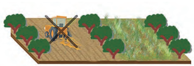
Figura 5. Dentro de las operaciones para controlar la cubierte vegetal espontánea no debe estar comprendido el laboreo del terreno.