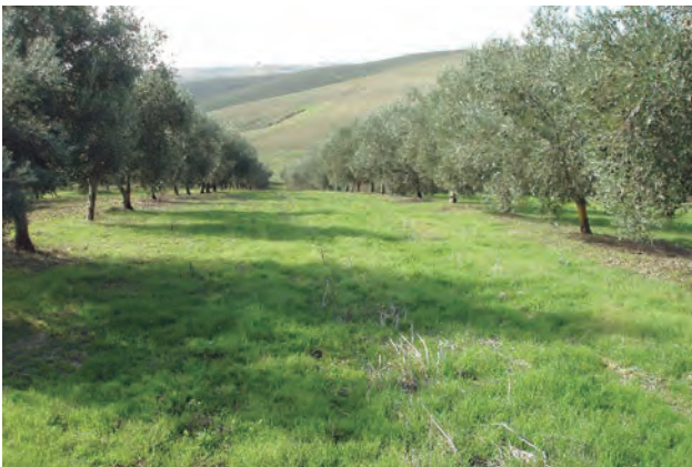
Figura 3. Cubierte vegetal surgiendo espontáneamente en las calles del olivar.