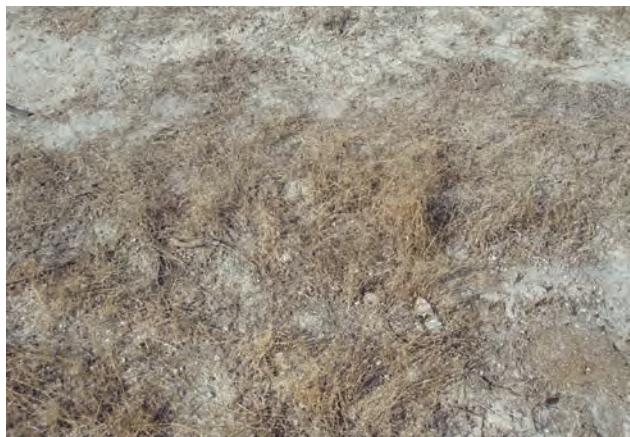
Figura 6. Los restos de la cubierta no deben ser retirados, permaneciendo sobre el suelo.

Los restos vegetales de la cubierta deben de permanecer sobre la superficie del suelo (Fig. 6).