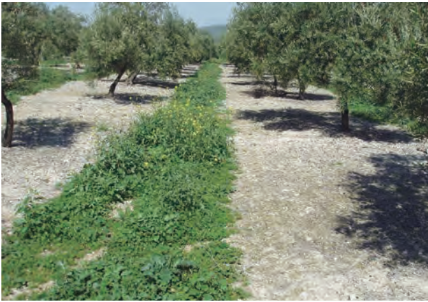
Figura 2. Cubierte vegetal espontánea en olivar.