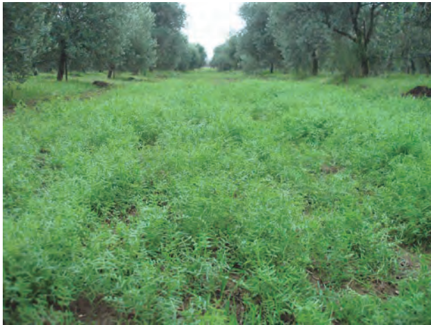
Figura 2. Cubierto vegetal en olivar, sembrado con una especie de leguminosa.