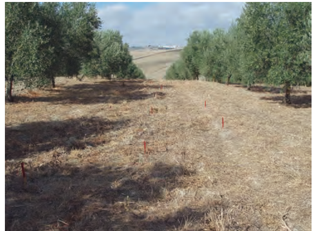
Figura 7. Los restos de la cubierta no deben ser retirados, permaneciendo sobre el suelo.

Los restos vegetales de la cubierta deben permanecer en superficie hasta la siembra de la siguiente cubierta. (Fig. 7).