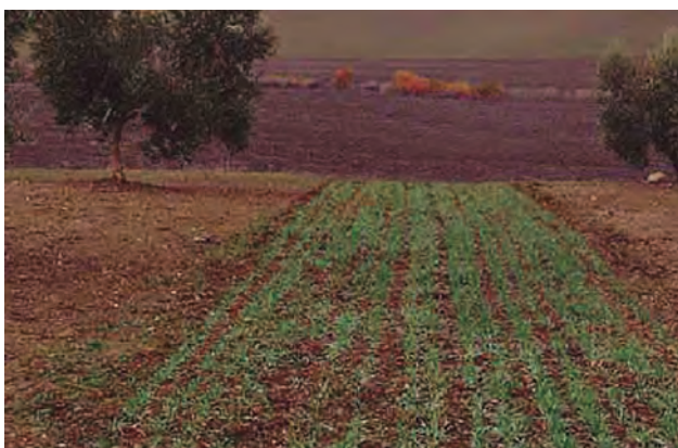
Figura 3. Cubierto vegetal sembrado en estado de emergencia.