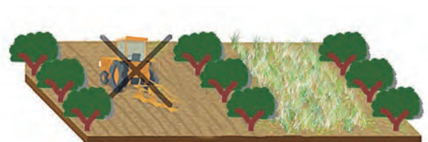
Figura 5. Dentro de las operaciones para controlar la cubierta vegetal no debe estar comprendido el laboreo del terreno.