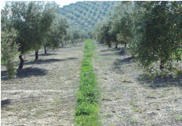
Figura 6. A partir del 15 de marzo debe perdurar, al menos, una banda de autosemillado superior a los 25 cm de anchura.

De 15 de marzo a 15 de mayo debe perdurar una banda de autosemillado de, al menos, 25 cm de ancho (Fig. 6).