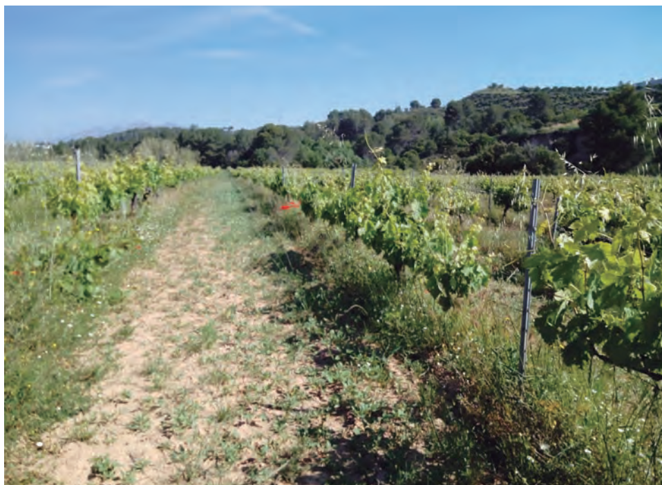
Cubierta espontánea en el Penedès

Una cubierta vegetal que surja espontáneamente en las calles, filas o taludes del viñedo.