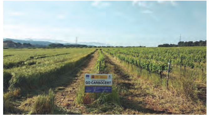
Cubierta vegetal de un viñedo demostrativo adyacente a un campo de cebada antes (izquierda) y después (derecha) de la siega de la cubierta espontánea.

La cubierta vegetal en la totalidad del viñedo sería la práctica que más carbono secuestra. Se recomienda que esta sea gestionada usando principalmente aperos de corte (segadoras, desbrozadoras, picadoras) o un laboreo muy superficial, y dejando siempre los restos en superficie. También sería viable la eliminación mediante sistemas térmicos (vapor, microondas) o químicos (aunque el uso de herbicida se desaconseja en el contexto de prácticas sostenibles y respetuosas con el medioambiente). Para el control hierbas en la fila se recomiendan los mismos tipos de gestión que podrían combinarse para una mayor eficiencia con mulching, ya sea procedente de la siega de la propia cubierta, ya sea de aporte externo (priorizando el mulching natural y de proximidad). También se puede utilizar ganado ovino o caprino para el control de la cubierta, que a la vez aporta nutrientes adicionales al suelo. Esta práctica es aconsejable solo durante el reposo invernal, ya que los animales también pastorean los brotes tiernos y racimos.