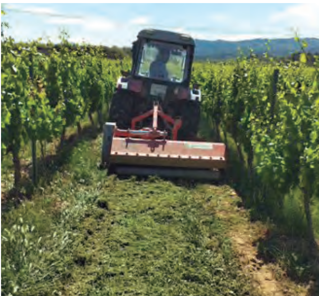
Siega de la cubierta vegetal.

La cubierta vegetal en la totalidad del viñedo sería la práctica que más carbono secuestra. Se recomienda que esta sea gestionada usando principalmente aperos de corte (segadoras, desbrozadoras, picadoras) o un laboreo muy superficial, y dejando siempre los restos en superficie. También sería viable la eliminación mediante sistemas térmicos (vapor, microondas) o químicos (aunque el uso de herbicida se desaconseja en el contexto de prácticas sostenibles y respetuosas con el medioambiente). Para el control hierbas en la fila se recomiendan los mismos tipos de gestión que podrían combinarse para una mayor eficiencia con mulching, ya sea procedente de la siega de la propia cubierta, ya sea de aporte externo (priorizando el mulching natural y de proximidad). También se puede utilizar ganado ovino o caprino para el control de la cubierta, que a la vez aporta nutrientes adicionales al suelo. Esta práctica es aconsejable solo durante el reposo invernal, ya que los animales también pastorean los brotes tiernos y racimos.