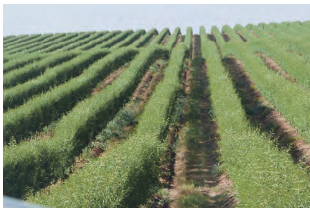
Cubierta vegetal en plantación intensiva de almendros, Segrià.

mulching, ya sea procedente de la siega de la propia cubierta, ya sea de aporte externo (priorizando el mulching natural y de proximidad). También se puede utilizar ganado ovino o caprino para el control de la cubierta, que a la vez aporta nutrientes adicionales al suelo. Esta práctica es aconsejable solo durante el reposo invernal, ya que los animales también pastorean las ramas más bajas.