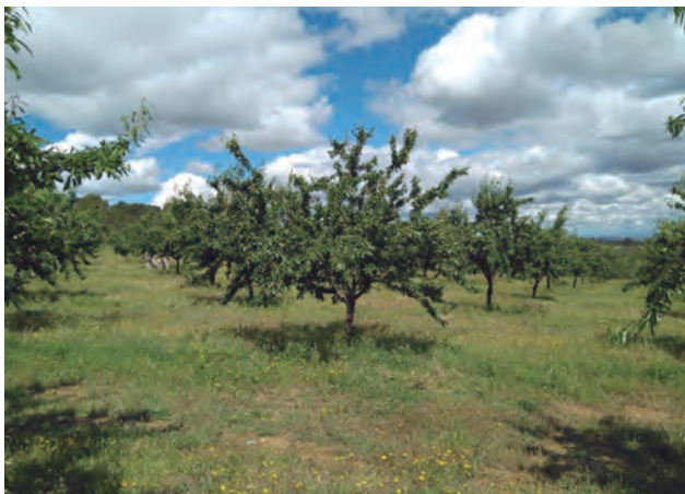
Cubierta sembrada en el Alt Camp.

Se sembrará una cubierta vegetal formada por semillas de una o varias especies en las calles de la plantación.