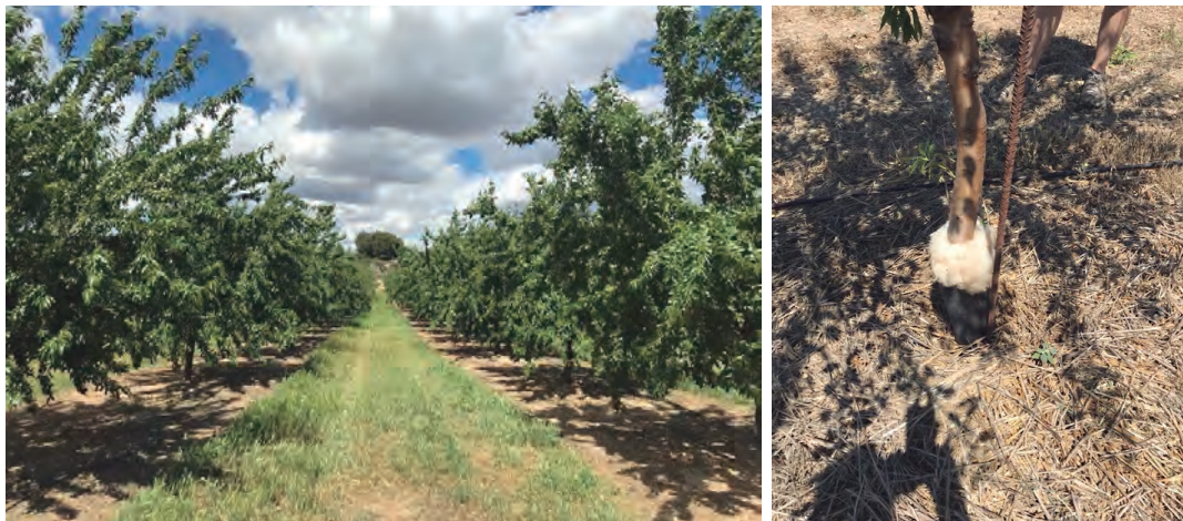
Cubierta vegetal de gramíneas en la calle: filas tratadas con herbicida bajo los árboles (izquierda). Aplicación de paja bajo los árboles (derecha).

mulching, ya sea procedente de la siega de la propia cubierta, ya sea de aporte externo (priorizando el mulching natural y de proximidad). También se puede utilizar ganado ovino o caprino para el control de la cubierta, que a la vez aporta nutrientes adicionales al suelo. Esta práctica es aconsejable solo durante el reposo invernal, ya que los animales también pastorean las ramas más bajas.